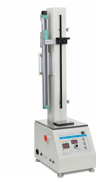
Motorisierter Prüfstand inkl. Längenmesssystem LD